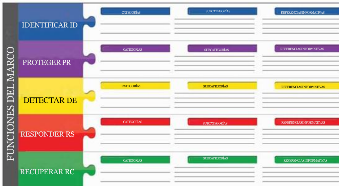
Figura 1: Estructura del Núcleo del Marco

El Núcleo del Marco proporciona un conjunto de actividades para lograr resultados específicos de seguridad cibernética y hace referencia a ejemplos de orientación en cómo lograr dichos resultados. El Núcleo no es una lista de verificación de las acciones a realizar. Este presenta los resultados clave de seguridad cibernética identificados por las partes interesadas como útiles para gestionar el riesgo de seguridad cibernética. El Núcleo consta de cuatro elementos: Funciones, Categorías, Subcategorías y Referencias Informativas, representadas en la Figura 1 :